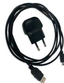
Netzteil 110 V / 220 V